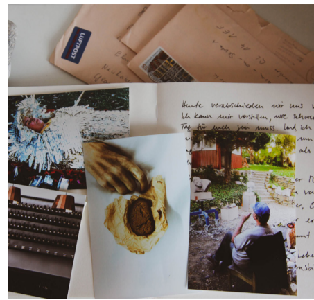
Bildkollage: Angelika Frey, 2022 (auch Titelfoto)

Kostenlose Teilnahme, aber begrenzte Platzzahl. Bitte um kurze Anmeldung per E-Mail an: cafelisbeth@elisabeth.berlin oder telefonisch: 030 4004 3349 (AB des Café Lisbeth).