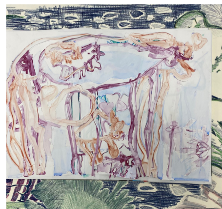
© Atalya Laufer, Delivery / The Birth of a Sky, 2022

Gefördert durch: NEUSTARTplus-Stipendium der Stiftung Kunstfonds / NEUSTART KULTUR der BKM